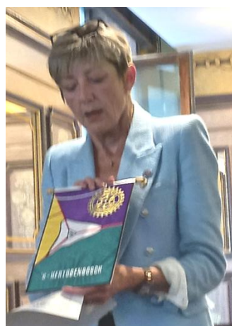
Le fanion du Rotary Club de 'S-Hertogenbosch