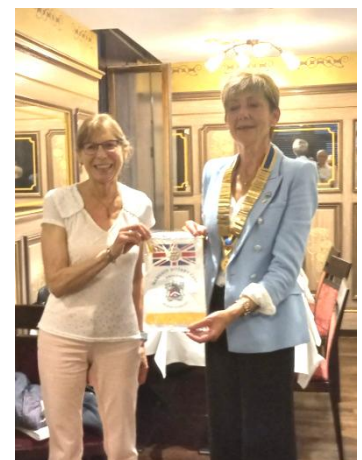
Le fanion du centenaire du Rotary Club de Margate